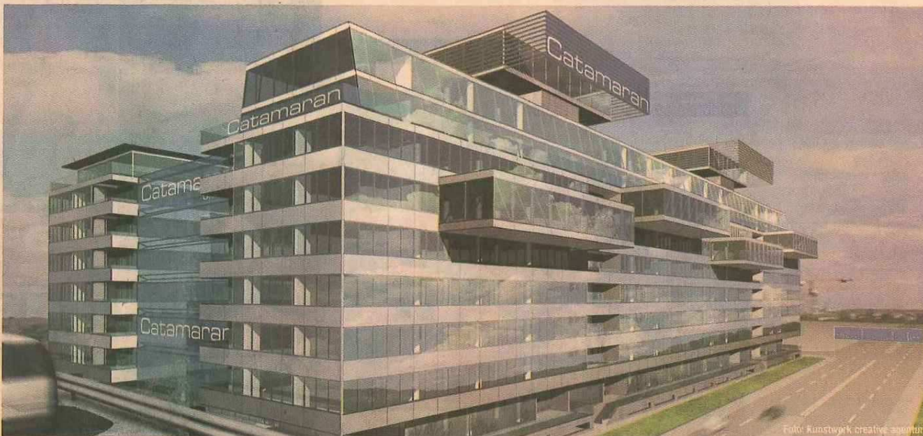
Der Catamaran steht kurz vor der Fertigstellung, vielleicht hat er bereits einen Preis bekommen, wenn die Mieter einziehen werden.

Das RUND VIER der Architekten Henke & Schreieck ist mit seiner konkav-konvexen Form ein Gebäude das sich durch Architektur und Raumqualität von der Masse abhebt, jedoch trotzdem eine harmonische Einheit in sich bildet.